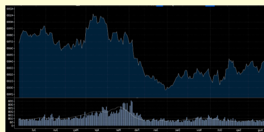
滬深 300 指日線圖