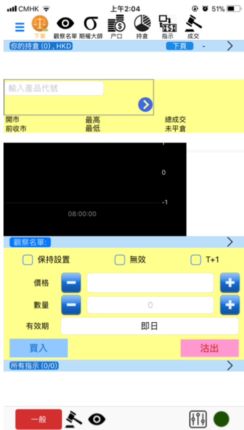
3，成功登入後將顯示上述畫面