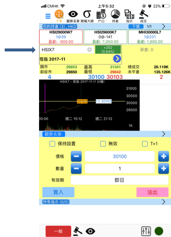
4，客戶可從此處直接輸入產品代號並進行交易